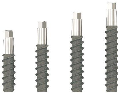
φ2.2 IT インプラント